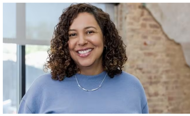
Prevención del Cáncer