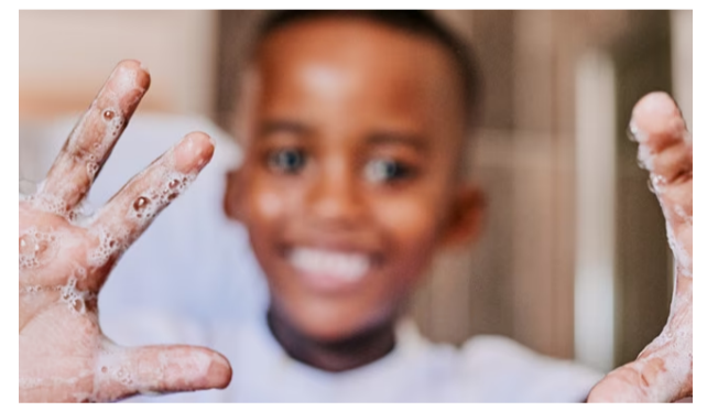
El lavado de manos salva vidas