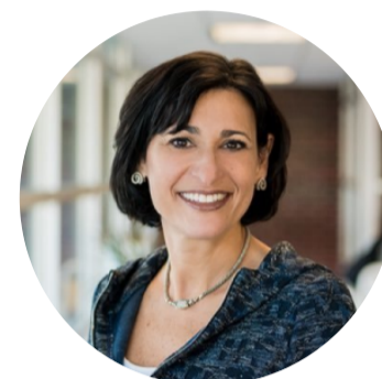
DIRECTORA DE LOS CDC Rochelle P. Walensky, MD, MPH