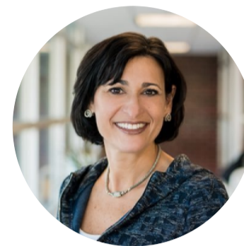
DIRECTORA DE LOS CDC Rochelle P. Walensky, MD, MPH