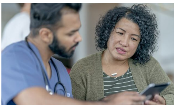
Control de la Diabetes