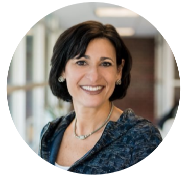
DIRECTORA DE LOS CDC Rochelle P. Walensky, MD, MPH