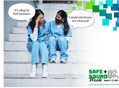
Employer Tips – Provide Access (ZIP) Spanish (ZIP)

Show empathy and reassure workers you are open and receptive to discussing mental health issues.