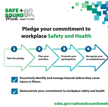
How to Pledge Graphic (ZIP)