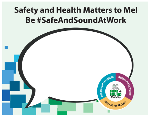
Safety and Health Matters to Me Shareable (ZIP)