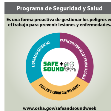
Safety and Health Programs – Spanish (ZIP)