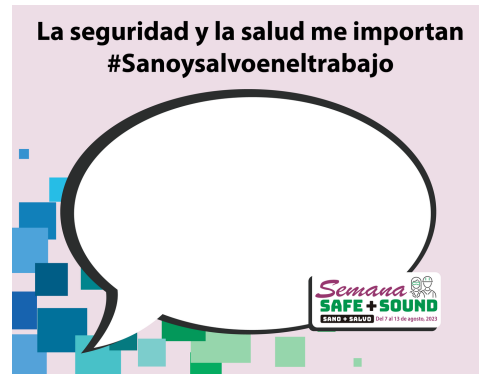
Safety and Health Matters to Me Shareable – Spanish (ZIP)