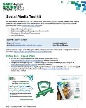
Safe + Sound Week Social Media Toolkit (PDF)