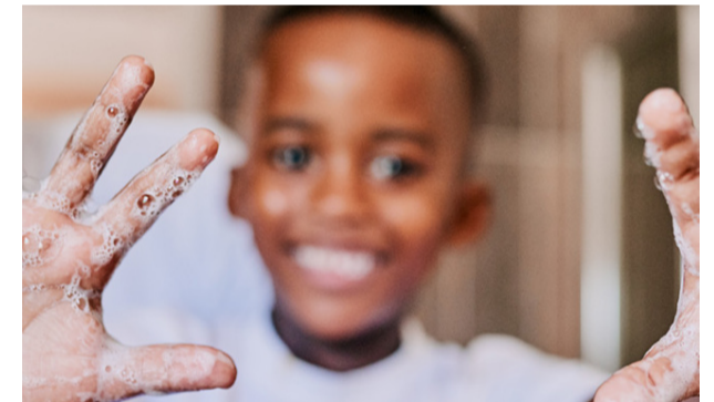
El lavado de manos salva vidas