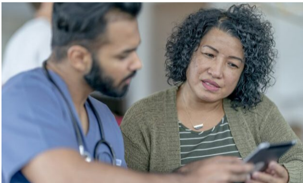
Control de la Diabetes