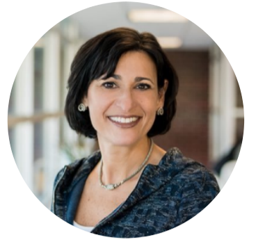
DIRECTORA DE LOS CDC Rochelle P. Walensky, MD, MPH