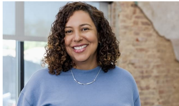
Prevención del Cáncer